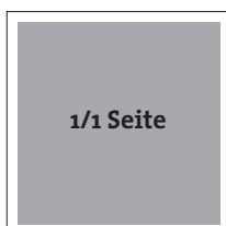
190 x 190 mm (Breite x Höhe)