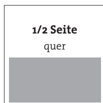
190 x 92 mm (Breite x Höhe)