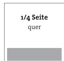
190 x 44 mm (Breite x Höhe)