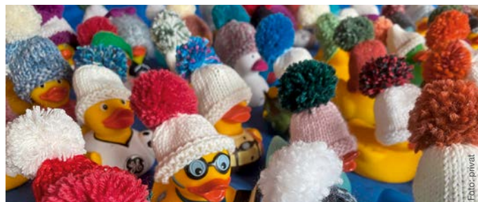
Eine bunte Parade von Gummienten trägt stolz ihre handgestrickten Mützchen – liebevoll gefertigt vom „Sock'n Woll“-Handarbeitskreis für den guten Zweck.

Ob Staubsauger, Soundbar, Flachbildschirme, Dartscheiben oder Nähmaschinen, alles was wir unter die Lupe genommen und auf das Herstellen der Funktionsfähigkeit geprüft. Wenn die Reparatur glückt, verlassen die Besitzer das MIO mit einem Lächeln. Der nächste Termin „Repaircafé“ findet am Samstag, den 11. April statt. Weitere Termine im ersten Halbjahr: 25.04., 09.05., 23.05., 06.06., 20.06.