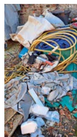
Berge von Müll jeglicher Herkunft hatten sich wieder einmal in und um Fischeln angesammelt.

auswahl und ein deftiger Eintopf aus der Landfleischerei Hinterding. Und nicht zuletzt nahmen alle einen weiteren Beleg für den Wahlspruch mit nach Hause: „Schütze ist man nicht mit dem Auge, sondern mit dem Herzen.“ br.