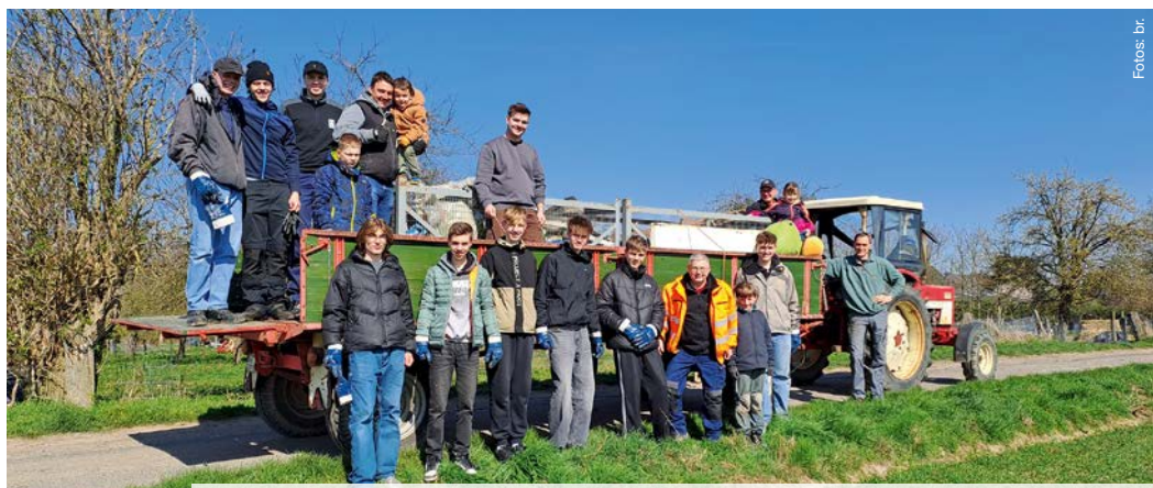
Was nach einer Fahrt ins Blaue aussieht, war harte Arbeit. Wenigstens das Wetter stimmte.