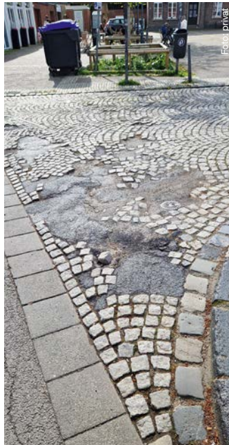
Pflaster auf der Marienstraße am Marienplatz.

Kann eine Stadt, die diese ewige Baustelle seit Jahren nicht nachhaltig sanieren kann, die Olympischen