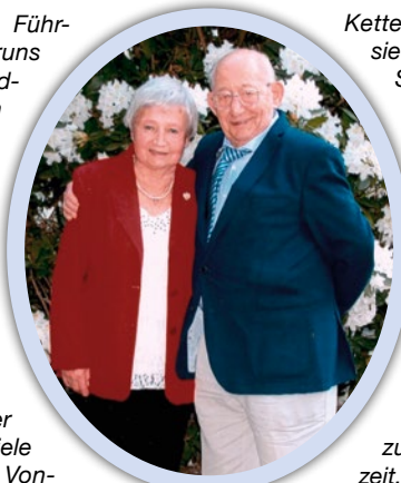
Ketteler-Straße, bevor sie gemeinsam in den Saassenhof zogen.