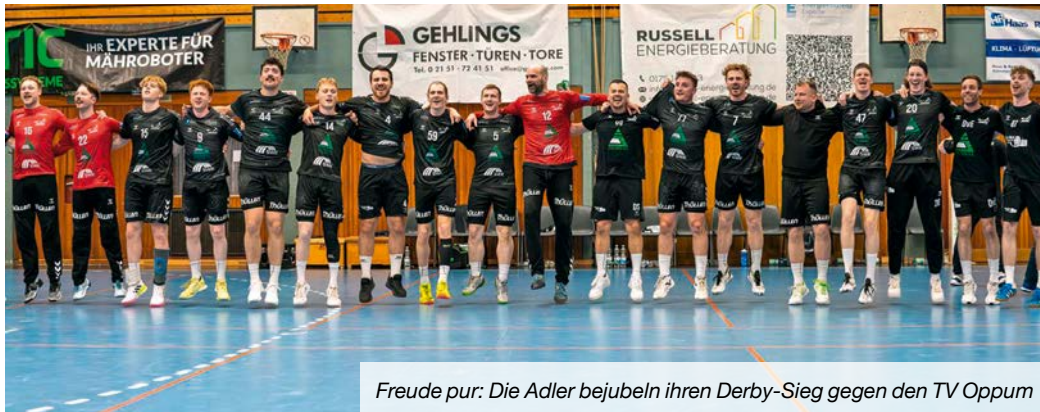
Freude pur: Die Adler bejubeln ihren Derby-Sieg gegen den TV Oppum