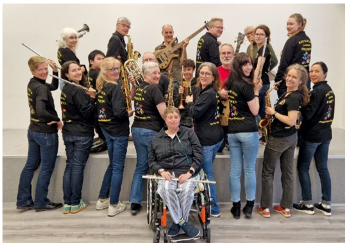
Das Pop & Rock Orchester Fischeln blickt zurück auf 17 Jahre Erfolgsgeschichte der Fischelner Bläuerschule.

Die Fischelner Bläuerschule e.V. feiert Geburtstag – und schenkt einen Sommer voller Musik!