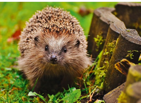
Auch für die Aufnahme von Igel kann die Förderung Wildtierhilfe genutzt werden.

Laut der Förderrichtlinie sind Ausgaben förderfähig wie Futtermittel, Verbrauchsmaterialien, Einstreu, Medikamente und Hilfsmittel, tierärztliche und tierseuchenrechtliche Maßnahmen und Behandlungen, Fahrtkosten zu Tierärzten oder -kliniken, Auffang- und Auswilderungsstationen, Reparatur-, Modernisierungs- und Renovierungsarbeiten und hierfür notwendige Materialkosten. Aktuell beläuft sich die jährliche Fördersumme der Stadt Krefeld auf insgesamt 5.000 Euro.