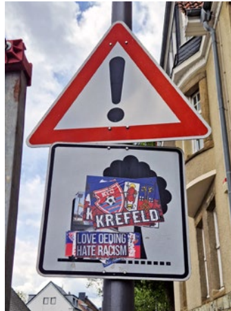
Das Foto zeigt das beklebte (und damit verdeckte) Verkehrsschild am Rathaus Fischeln.