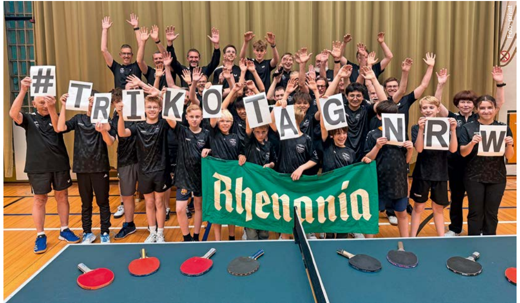
Zum Trikot-Tag 2026 zeigten die Tischtennisfreunde von Rhenania Königshof stolz ihre Sportanzüge.

Dort sollte und wurde dann ein witziges Foto angefertigt, um es anschließend an den Landessportbund senden zu können. Dieses Foto und die der anderen teilnehmenden Vereine kommen dann zur