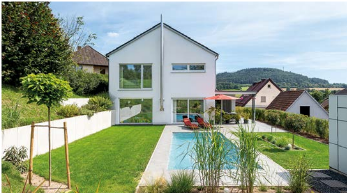
Ein eigener Pool vom Fachbetrieb bietet viele Vorteile. Spaß, Gesundheit und Wohlbefinden gehören dazu.

Wann ist die richtige Zeit, um einen Gartenpool zu planen. Was ist dabei wichtig? Wo findet man Schwimmbadbaufachbetriebe? Was ist in Sachen Umweltschutz und Kindersicherheit zu beachten? Der Bundesverband Schwimmbad & Wellness e.V. (bsw) klärt auf.