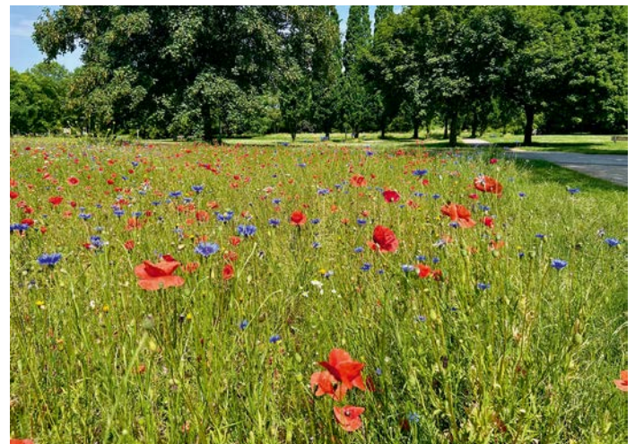
Leserin Heike Bahr hat uns dieses schöne Foto geschickt und schreibt dazu: „Jedes Mal, wenn ich mit dem Rad durch den Fischelner Stadtpark fahre, erfreue ich mich an dem wunderschönen Blütenmeer und finde es eine richtig tolle Idee, solche Oasen zwischen den Grasflächen stehen zu lassen.“