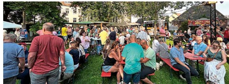
Auch der 4. Fischelner Feierabendmarkt war ein voller Erfolg. Schon am Nachmittag füllte sich der Rathausgarten. Bei bestem Wetter (entgegen der Voraussage) feierte Fischeln bis zur erstmalig verlängerten Sperrstunde um 23 Uhr. Laut Aussage des Fischelner Werberings steht die Planung bereits für die 5. Ausgabe. HEH

Termin 14.06.2026, Markuskirche, Fischeln, Kölner Straße 480, Einlass 16.00 Uhr, Beginn 17.00 Uhr, Eintritt € 25, Vorverkauf bei Foto Fuchs, Kölner Straße 550, et Kabäusken (Hafels), Kölner Straße 532, per E-Mail: h.krueppel@gmx.de, bei der Ticketbande oder an der Abendkasse.