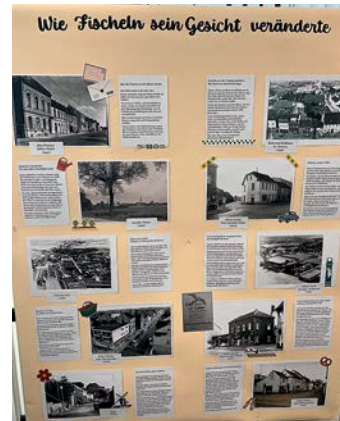
Eine der übersichtlichen Schautafeln, die zum optischen Stöbern einladen. Lesefreundlich!